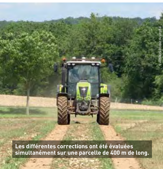
Les différentes corrections ont été évaluées simultanément sur une parcelle de 400 m de long.

Le système RTK ( Real Time Kinematic ) est la seule correction centimétrique permettant de revenir au même endroit. À chaque instant, la position calculée par les satellites d'une ou de plusieurs bases RTK est comparée à la position réelle de chaque base. Le différentiel de position ainsi calculé (sur une ou plusieurs bases) constitue la correction à appliquer au tracteur. Cette correction est transmise par ondes radio ou téléphone.