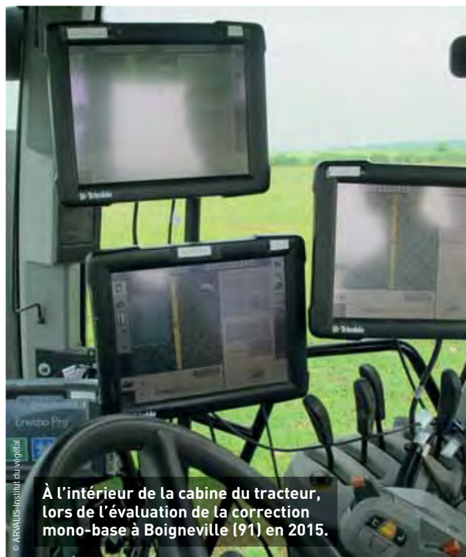
À l'intérieur de la cabine du tracteur, lors de l'évaluation de la correction mono-base à Boigneville (91) en 2015.

temps, soit une correction inférieure à \pm 2 cm en moyenne. De plus la correction fournie est répertoriée (figure 1). Cette précision est très proche de celle mesurée via la correction N-RTK ( \pm 3,5 cm, 95 % du temps) ; la différence de 0,2 cm entre les deux corrections n'est pas perceptible en autoguidage. Cependant, lors de deux enregistrements sur huit (10 % du temps enregistré), les essais ont montré une instabilité de la correction mono-base MS-Pré (figure 2) avec des erreurs ponctuelles de l'ordre de \pm 10-15 cm pendant plusieurs minutes, ce qui correspond à une distance de 400 et 700 m au regard de la vitesse d'avancement du tracteur lors de ces deux enregistrements. Durant ces périodes, la précision de la correction N-RTK (solution réseau) est restée stable et inférieure à \pm 2 cm (figure 2). Le fait que la correction ait été calculée sur une seule base serait donc bien en cause dans le décalage constaté. L'origine de ces instabilités n'est pas expliquée pour l'instant. Sur ces périodes, l'activité ionosphérique était équivalente aux jours précédents. Ces instabilités sont acceptables si